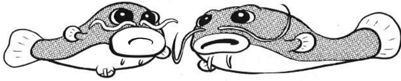
イラスト 福地孝真